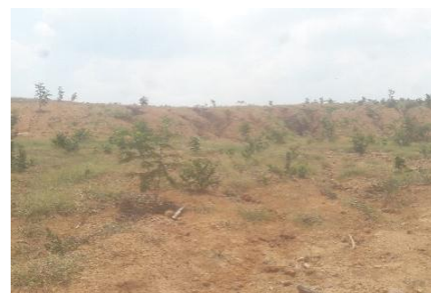
Gambar 7. Revegetasi pada area disposal dengan tanaman sengon pada salah satu bagiannya