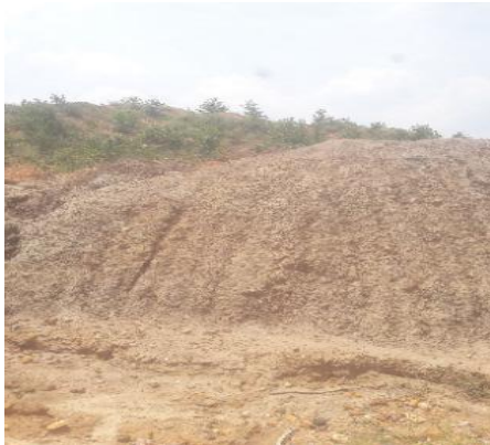
Gambar 5. Erosi oleh air hujan

Setelah dilakukan analisis pada pengendalian erosi maka masih terjadi erosi-erosi yang terdapat pada sekitar area reklamasi (Gambar 5). Hal ini disebabkan karena masih belum terealisasinya pengendalian erosi yang dilakukan oleh perusahaan sehingga perlu merealisasikan rencana yang akan dilakukan oleh perusahaan supaya resiko terjadinya erosi menjadi berkurang.