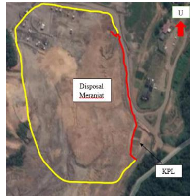
Gambar 3. Panjang saluran drainase

Solusi untuk Pengendalian Erosi lainnya adalah perusahaan menanam tanaman cover crop berupa kacang-kacangan ( Calopogonium mucunoides ) sebagai solusi untuk pengendalian erosi (Gambar 4). Sebagai rencana perusahaan menebarkan tanaman cover crop berupa Calopogonium mucunoides sebanyak 20 kg per ha realisasinya adalah perusahaan baru menebarkan tanaman Calopogonium mucunoides sebanyak 2 kg per ha sehingga realisasi baru berjalan 10% (Tabel 4).