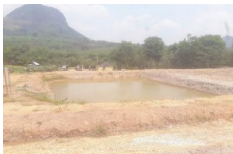
Gambar 8. Kolam pengendapan lumpur

Kondisi aktualnya adalah sebelum tanah pucuk dikembalikan ke tempat asal, perusahaan memasukkan kandungan paf dan naf ke dalam tanah sehingga saat tanah pucuk dikembalikan ke tempat asal tanah tersebut sudah mengandung kandungan paf dan naf. Solusi lainnya adalah dengan membuat Kolam Pengendap Lumpur yang dibangun untuk proses pengendapan material padat yang dibawa oleh air limpasan (Gambar 8). Hal ini dilakukan sebagai upaya mengatasi permasalahan air yang merupakan salah satu penghambat terbesar kegiatan penambangan sebelum dialirkan ke sungai.