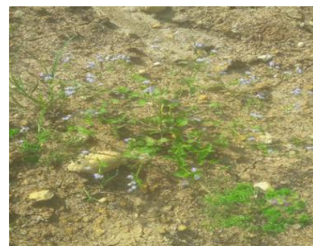
Gambar 4. Tanaman cover crop

Solusi untuk Pengendalian Erosi lainnya adalah perusahaan menanam tanaman cover crop berupa kacang-kacangan ( Calopogonium mucunoides ) sebagai solusi untuk pengendalian erosi (Gambar 4). Sebagai rencana perusahaan menebarkan tanaman cover crop berupa Calopogonium mucunoides sebanyak 20 kg per ha realisasinya adalah perusahaan baru menebarkan tanaman Calopogonium mucunoides sebanyak 2 kg per ha sehingga realisasi baru berjalan 10% (Tabel 4).