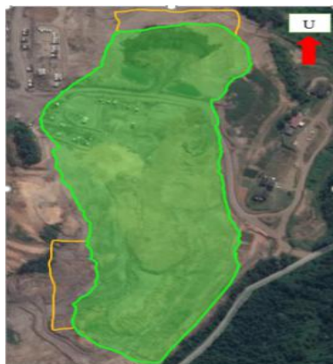
Gambar 2. Peta luas penebaran tanah zona pengakaran

Kondisi aktual dari Penebaran Tanah Zona Pengakaran adalah penghamparan tanah zona pengakaran area disposal meranjat berjalan dengan rencana luas lahan sebesar 14.91 Ha sudah terealisasi sampai dengan sekarang dengan luas lahan 12.276 Ha sehingga persentasenya adalah 82,3%. Ketebalan top soil dari area disposal adalah 30 cm. Top Soil diangkut dari penyimpanan sementara yang berjarak 1,2 km dari lokasi. Alat-alat yang bekerja adalah excavator dan dumptruck. Sedangkan pH tanah yang berada di tanah zona pengakaran dikategorikan sedang ke buruk karena setelah dilakukan analisis uji lab pH tanah berada di nilai pH 4,5 ke bawah sehingga pH tanah zona pengakaran berada di nilai sedang ke buruk. Peta luas penebaran tanah zona pengakaran dapat dilihat pada Gambar 2.