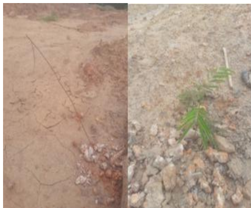
Gambar 9. Kegiatan penyulaman

Kondisi aktual pada kegiatan Penutupan Tajuk berdasarkan pengamatan di lapangan belum ada proses penutupan tajuk (Tabel 11). Hal ini karena umur revegetasi kurang lebih 7 bulan.