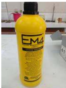
Gambar 1. Effective Microorganism-4