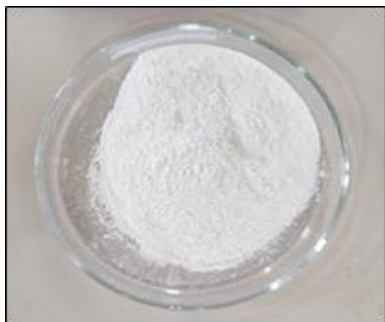
Gambar 3. Selulosa Asetat dari Kertas Bekas

degradasi selulosa asetat. Tabel 1. menunjukkan hubungan antara kadar asetil dan derajat substitusi selulosa asetat. Derajat substitusi dari selulosa asetat semakin berkurang seiring juga dengan berkurangnya kadar asetil dari selulosa asetat. Kadar asetil yang sedikit menunjukkan bahwa sedikitnya juga gugus asetil yang tersubstitusi (Souhoka dan Latupersiana, 2018). Selulosa asetat yang dihasilkan dari penelitian ini merupakan suatu zat padatan berwarna putih yang dapat dilihat pada Gambar 3.