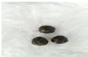
Gambar 1. Urea Modifikasi

Dari penelitian yang dilakukan didapatkan bahwa urea modifikasi cukup baik dibentuk tanpa adanya pemanasan pada saat pencampuran. Hal ini disebabkan dari produk yang diinginkan bahwa urea modifikasi diinginkan masih dalam bentuk padatan. Pada saat pembuatan urea modifikasi dengan pemanasan, dihasilkan urea modifikasi yang sangat encer, dikarenakan NaOH dan urea yang sifatnya higroskopis yang mengakibatkan NaOH dan urea cepat sekali mengencer. Maka, dibuatlah urea modifikasi tanpa pemanasan dan dihasilkan produk pada Gambar 1 di bawah ini.