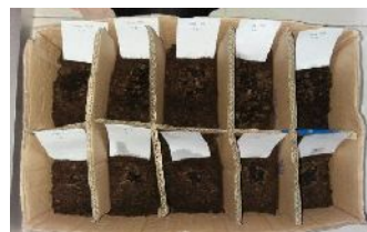
Gambar 2. Hasil pengujian produk setelah 12 jam

Dari hasil uji terhadap waktu release yang didapatkan dalam masing-masing 250 gram sampel tanah terdiri dari lima sampel dengan perbandingan 1, 2, 3, 4, 5 gram urea dan lima sampel yang lain dengan perbandingan 1, 2, 3, 4, 5 gram urea modifikasi (SRF) adalah sebagai berikut.