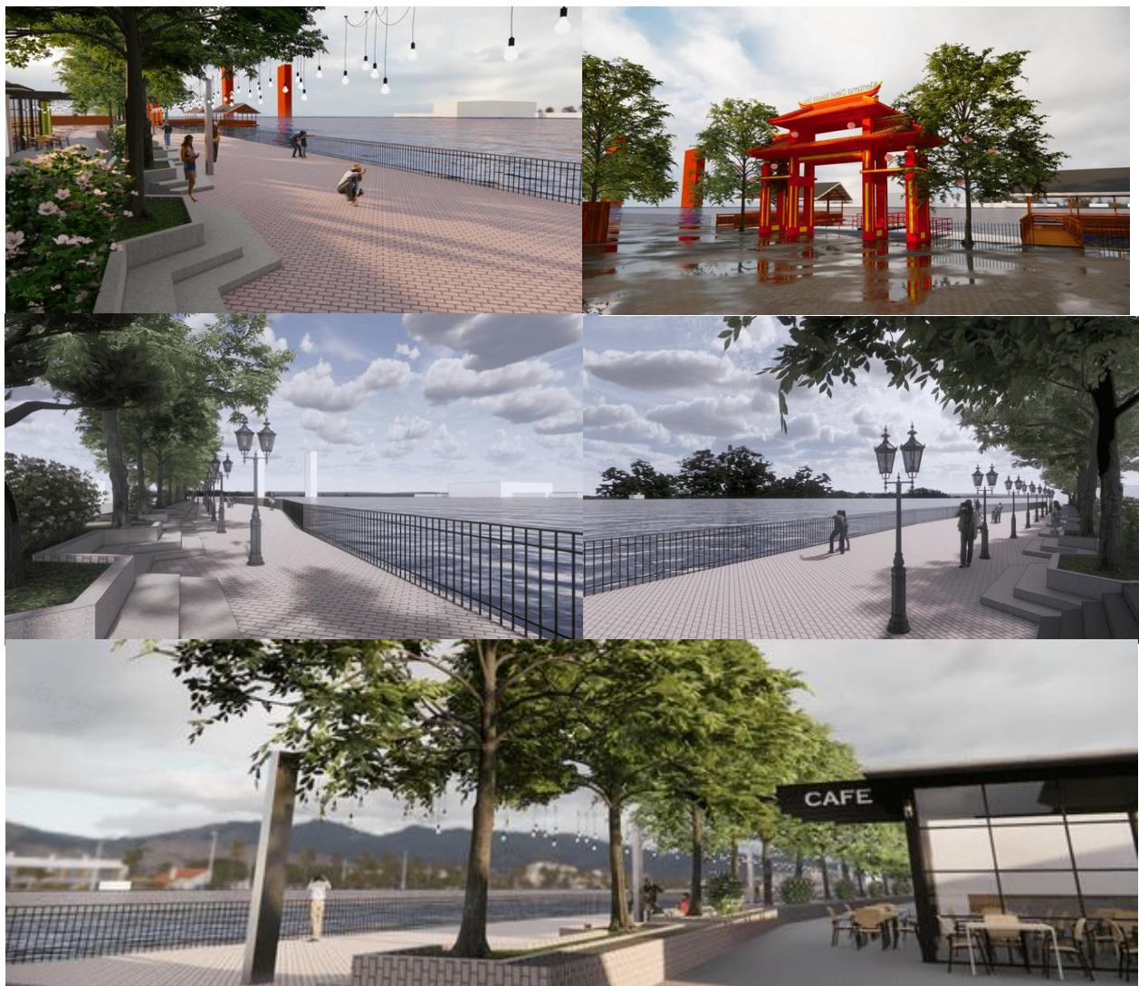
Gambar 2. Ilustrasi perbaikan Fasilitas di Ruang Terbuka Tepian Sungai