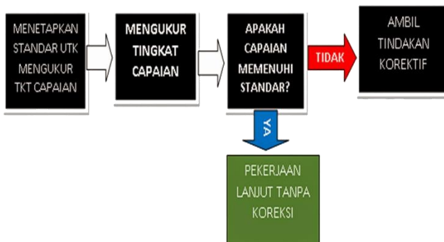
Gambar 2. Tahap Dasar Monitoring

Monitoring merupakan sebuah proses pengumpulan data dengan tujuan mengukur kemajuan dari sebuah kegiatan. Monitoring juga digunakan untuk memperbaiki kesalahan yang menyimpang dari rencana yang telah ditetapkan sebelumnya. Tahapan ini juga bermaksud untuk mengupayakan agar kegiatan yang dilakukan sesuai dengan tujuan yang diharapkan dan dicapai sebaik mungkin (Prasanto, 2021). Proses dasar dalam monitoring meliputi 3 tahap seperti pada gambar 3 berikut.