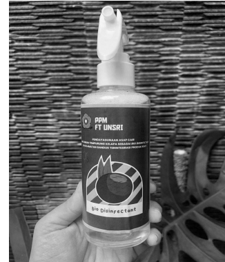
Gambar 5. Produk Bio-disinfektant

jernih berwarna kuning keemasan. Asap cair grade-2 ini berupa konsentrat yang dalam penggunaannya dicampurkan dengan air dengan takaran 60 mL asap cair untuk 1 L air. Asap cair ini dapat dijadikan in door bio-disinfektant . Gambar 5 memperlihatkan produk bio-disinfektant dari asap cair tempurung kelapa yang sudah dikemas dalam kemasan botol plastik dan siap digunakan.