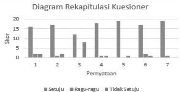
Gambar 9. Hasil Responden Masyarakat

Kuesioner terdiri atas tujuh pernyataan mengenai materi, produk yang didemonstrasikan, serta respon masyarakat terhadap program pengabdian. Opsi jawaban dari tujuh pernyataan tersebut ada tiga yaitu, “Setuju”, “Ragu-ragu”, atau “Tidak Setuju”. Hasil responden masyarakat dijabarkan pada Gambar 9. Mayoritas responden menunjukkan respon positif dalam menjawab kuesioner. Hasil responden pada “Pernyataan 1” yaitu, terdapat 16 orang menjawab setuju, 2 orang memilih ragu-ragu, dan 2 orang menjawab tidak setuju. Jumlah ini menunjukkan bahwa mayoritas masyarakat sudah mengetahui dan menyadari dampak negatif dari limbah tempurung kelapa yang ada pada daerah mereka. Hal ini dapat menjadi urgensi bahwa dampak limbah tempurung kelapa ini sudah dirasakan oleh masyarakat sekitar.