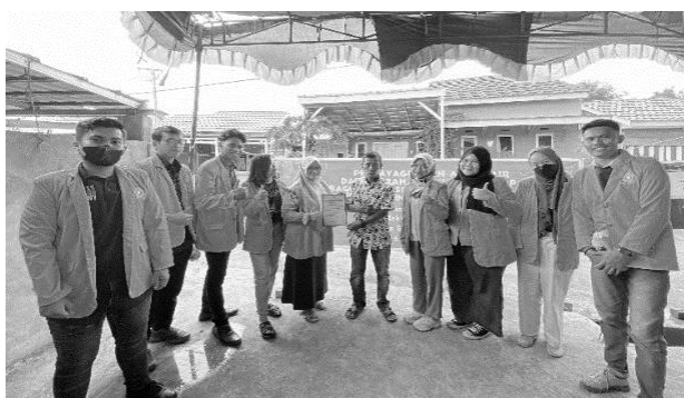
Gambar 10. Penyerahan Hadiah dan Cinderamata Kepada Masyarakat

Kuesioner yang berisikan “Pernyataan 6” memuat hasil 17 responden menjawab “Setuju”, 2 responden menjawab “Ragu-ragu”, dan 1 responden menjawab “Tidak Setuju”. Jawaban ini membuktikan bahwa, mayoritas masyarakat merasa mereka mendapat ilmu pengetahuan baru dari kegiatan ini. Pelaksanaan pengabdian ini mampu untuk menarik minat masyarakat mengenai pengolahan limbah tempurung kelapa. Kuesioner terakhir pada “Pernyataan 7” menunjukkan sebanyak 19 responden menjawab “Setuju” dan 1 orang memilih “Ragu-ragu”. Menurut jumlah respon yang didapat berarti masyarakat menunjukkan ketertarikan kepada pengabdian masyarakat dengan tema sejenis.