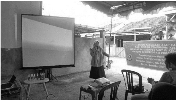
Gambar 7. Penyuluhan oleh Ketua Tim

Pelaksanaan kegiatan sosialisasi pengabdian dilaksanakan dengan metode penyuluhan dan dilanjutkan pemutaran video proses produksi bio-disinfektan . Penyuluhan mengenai pendayagunaan asap cair dari limbah tempurung kelapa menjadi bio-disinfektan diberikan dan disampaikan oleh ketua tim seperti yang tampak pada Gambar 7. Materi yang disampaikan terkait preparasi bahan baku tempurung kelapa dan proses pembuatan bio-disinfektan .