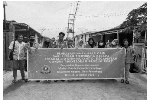
Gambar 6. Tim Pengabdian Masyarakat

Pendayagunaan asap cair dari limbah tempurung kelapa menjadi bio-disinfektant diambil dari Kecamatan Gandus dan tempat pengumpulan limbah tempurung kelapa. Bahan baku proses pembuatan bio-disinfektant dipersiapkan oleh tim pelaksana dan mahasiswa yang bersangkutan. Kemudian proses pembuatan rangkaian alat dan pembuatan bio-disinfektant dilakukan oleh anggota tim dan mahasiswa. Kegiatan pengabdian direncanakan dilakukan dalam waktu satu hari mengenai potensi pemanfaatan limbah tempurung kelapa menjadi bio-disinfektant di Kecamatan Gandus. Pelatihan yang dilakukan akan dinarasumberi oleh staf dosen Fakultas Teknik universitas Sriwijaya selaku ketua dan anggota dari pengabdian masyarakat ini. Pada Gambar 6 terdapat dokumentasi anggota tim pengabdian masyarakat yang turut ikut berpartisipasi di dalam kegiatan ini. Komposisi tim pengabdian kepada masyarakat terdiri dari 1 dosen sebagai ketua dengan 6 dosen sebagai anggota. Selain itu, terdapat 2 orang mahasiswa angkatan 2019 dan 6 orang mahasiswa angkatan 2020 dari Jurusan Teknik Kimia Universitas Sriwijaya.