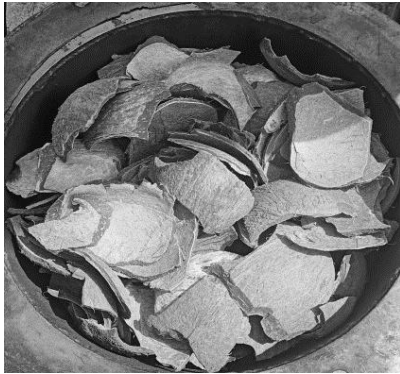
Gambar 3. Bahan Baku Limbah Tempurung Kelapa

rentang 5-10 cm, setelah itu akan dilakukan pengeringan bahan baku dalam suhu 100°C selama 1 jam.