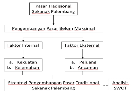
Gambar 2 Kerangka berpikir.

Analisis SWOT digunakan untuk membahas faktor internal dan faktor eksternal pengembangan Pasar Tradisional Sekanak (Gambar 2). Analisis SWOT menggambarkan secara jelas bagaimana peluang dan ancaman yang dihadapi dapat disesuaikan dengan kekuatan dan kelemahan yang dimiliki oleh Pasar Tradisional Sekanak.