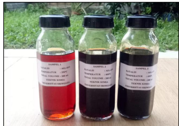
Gambar 2. Hasil konversi sampah plastik menjadi bahan bakar

Bahan baku yang digunakan berasal dari semua jenis sampah plastik. Penelitian yang pernah dilakukan yaitu mengkonversi sampah plastik jenis polistirena. Dari hasil penelitian tersebut terbukti peralatan terintegrasi ini dapat mengkonversi sampah plastik menjadi bahan bakar. Penelitian terbaru yang dilakukan menghasilkan dominan fraksi bensin sebanyak 75% dari volume 100 mL sampel. Gambar 2 merupakan contoh produk hasil penelitian konversi sampah plastik sebelum dilakukan distilasi.