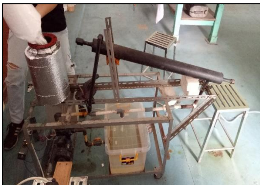
Gambar 1 Peralatan konversi sampah plastik menjadi bahan bakar

Beberapa penelitian pernah dilakukan diantaranya Houshmand et al.(2013) degradasi menggunakan thermal dan katalis novel di dalam sebuah vessel dengan proses pirolisis menghasilkan liquid, gas dan residu solid. Selektivty aromatic lebih dari 99% menggunakan temperatur 350-410 °C dengan range 20 °C. Rachmawati (2015) Pengolahan sampah secara pirolisis dengan variasi rasio komposisi sampah dan jenis plastik, plastik yang digunakan adalah HDPE, PE, PET dan PS dengan temperature 50 °C dan waktu 30 menit meghasilkan gas dan wax. Selpiana et al (2019) mengkonversi limbah plastik jenis Polistirena menjadi Bahan Bakar Cair jenis gasoline dan diesel.