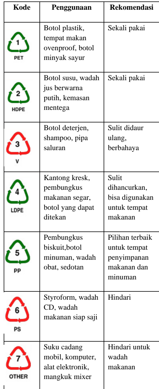
Tabel 1. Rekomendasi Penggunaan Plastik

Tabel 1 menjelaskan tentang kode produk plastik, penggunaannya di kehidupan sehari-hari serta rekomendasi penggunaan terbaik agar aman untuk tubuh dan lingkungan.