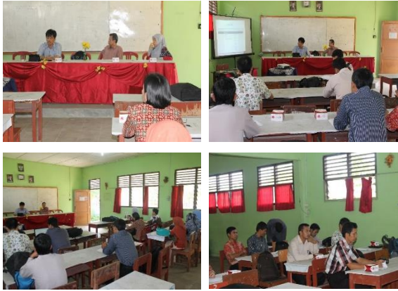
Gambar 3 Pelaksanaan kegiatan