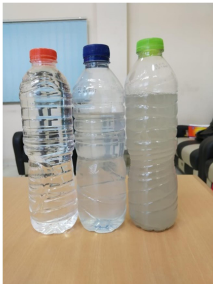
Gambar 3. Air limbah laundry sebelum, setengah, dan setelah proses.

Penggunaan alat yang sederhana ini tidak hanya mempermudah para industri jasa laundry rumahan namun juga dapat diterapkan di dalam kehidupan rumah tangga yang sumber air nya berbau karat ataupun keruh yang disebabkan oleh lingkungan air sumur sekitar.