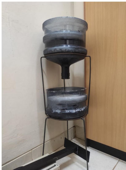
Gambar 1 Filterisasi dari Galon Bekas

Dengan menggunakan penyaringan berulang secara sederhana dan penggunaan karbon aktif untuk melihat efisiensi penurunan kadar COD, tingkat kekeruhan dan aroma tidak sedap pada air limbah laundry. Penggunaan 2 media penyaringan bertingkat yang mengandalkan galon atau wadah plastik yang tidak terpakai lagi disusun dengan skala laboratorium. Ukuran media penyaringan berdiameter 30cm dengan tinggi 60 cm seperti yang ditunjukkan pada Gambar 1.