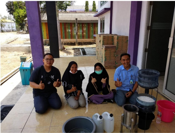
Gambar 2. Proses perancangan dan pengujian alat penjernihan air limbah laundry